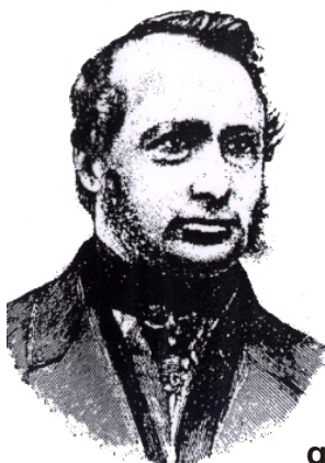
Friedrich Güll (1812-1879) geboren in Ansbach