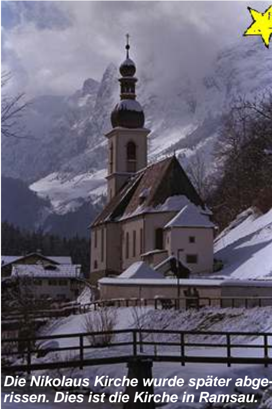
Die Nikolaus Kirche wurde später abgerissen. Dies ist die Kirche in Ramsau.

In vielen Ländern der Welt wird zur Weihnachtszeit das Lied "Stille Nacht, heilige Nacht" gesungen. In Deutschland, in der Schweiz und natürlich in Österreich, woher das Lied kommt, kennt es fast jedes Kind.