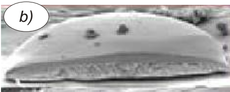
Käferschuppen a) Mikroskop b) Elektronenmikroskop