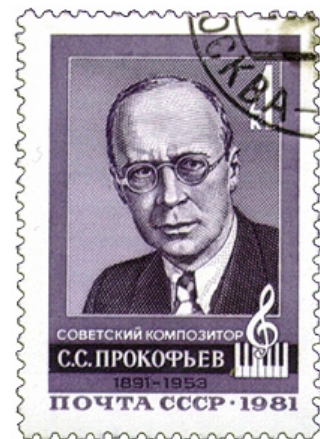
Sergej Prokofjew (1891-1953)