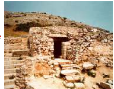
Überreste des Gefängnisses in Philippi

Da stellte sich die aufgehetzte Menschenmenge drohend gegen Paulus und Silas, und man ließ den beiden die Kleider vom Leib reißen und sie auspeitschen. Nachdem sie so brutal misshandelt worden waren, warf man sie ins Gefängnis und gab dem Aufseher die Anweisung, die Gefangenen besonders scharf zu bewachen.