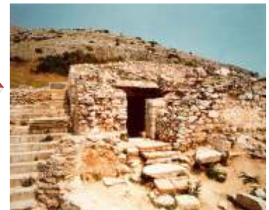
Überreste des Gefängnisses in Philippi

Da stellte sich die aufgehetzte Menschenmenge drohend gegen Paulus und Silas, und man ließ den beiden die Kleider vom Leib reißen und sie auspeitschen. Nachdem sie so brutal misshandelt worden waren, warf man sie ins Gefängnis und gab dem Aufseher die Anweisung, die Gefangenen besonders scharf zu bewachen.