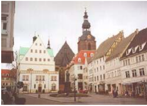
Marktplatz von _____ mit _____-Denkmal