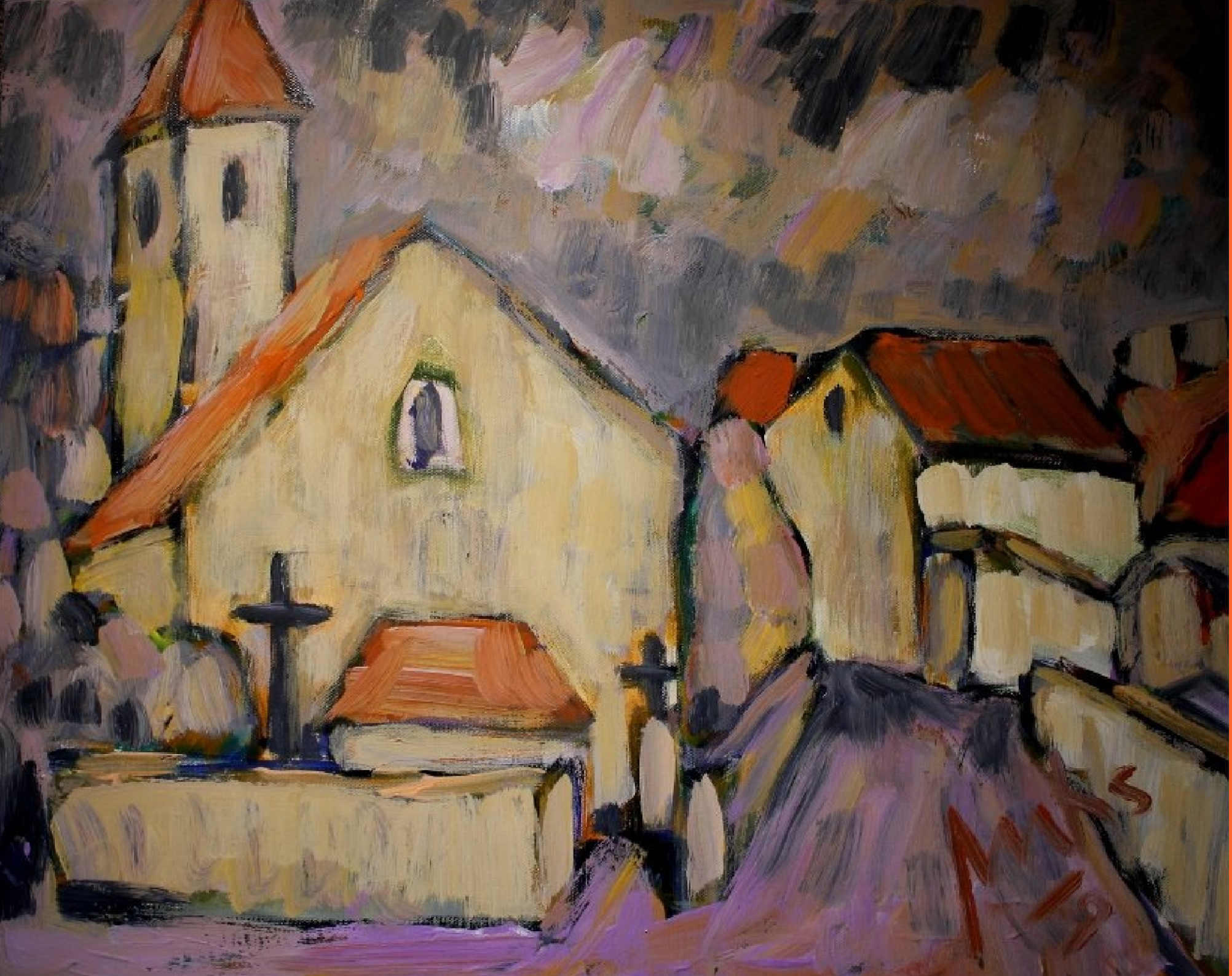
Dorfkirche in Taizé / Burgund)