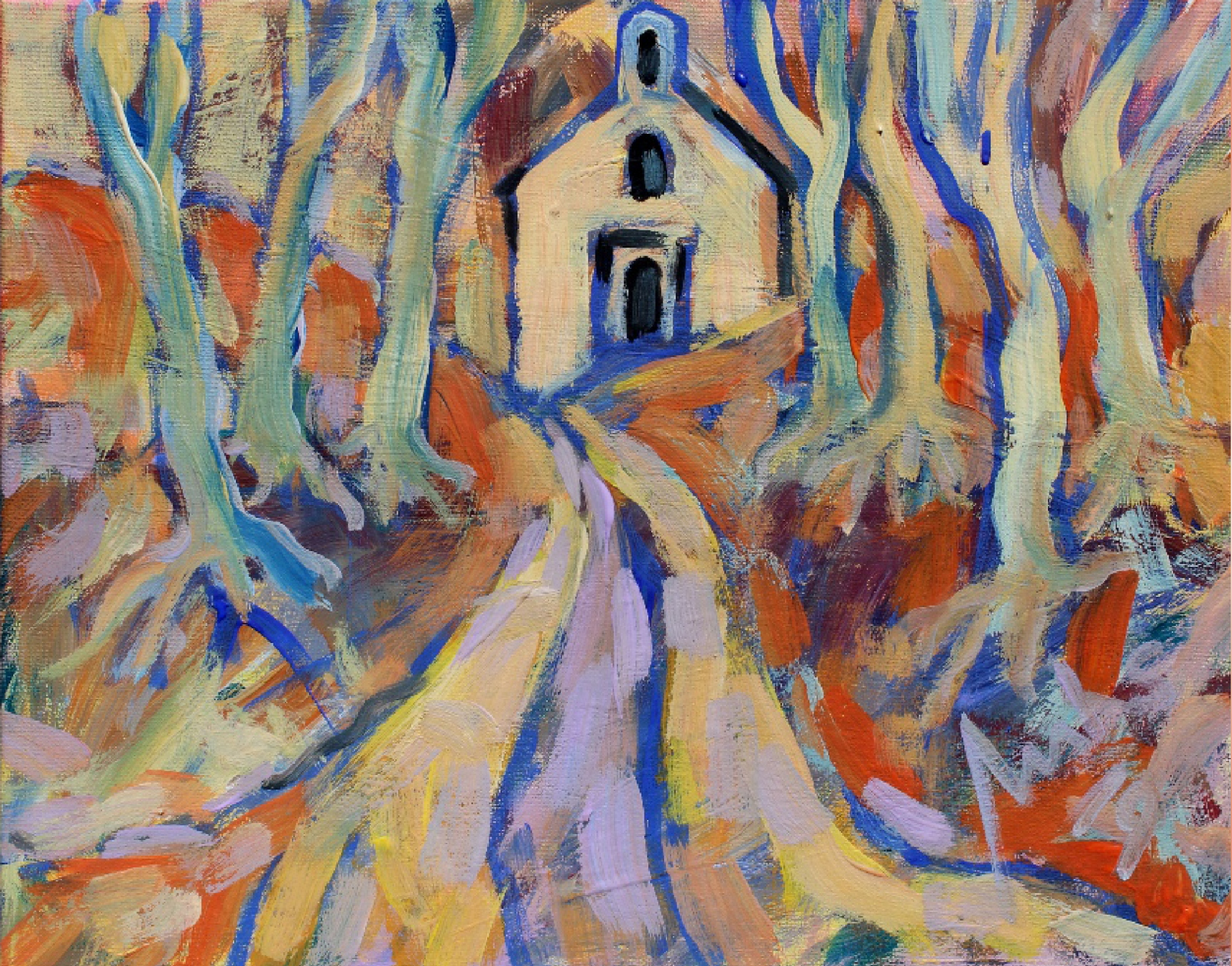
Chapelle Les Baux