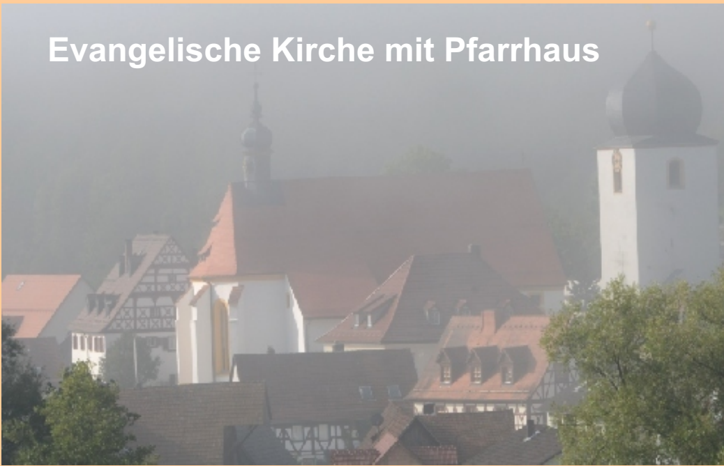
Evangelische Kirche mit Pfarrhaus