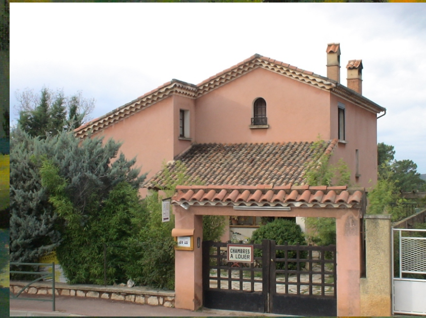
Unser Quartier in Roussillon