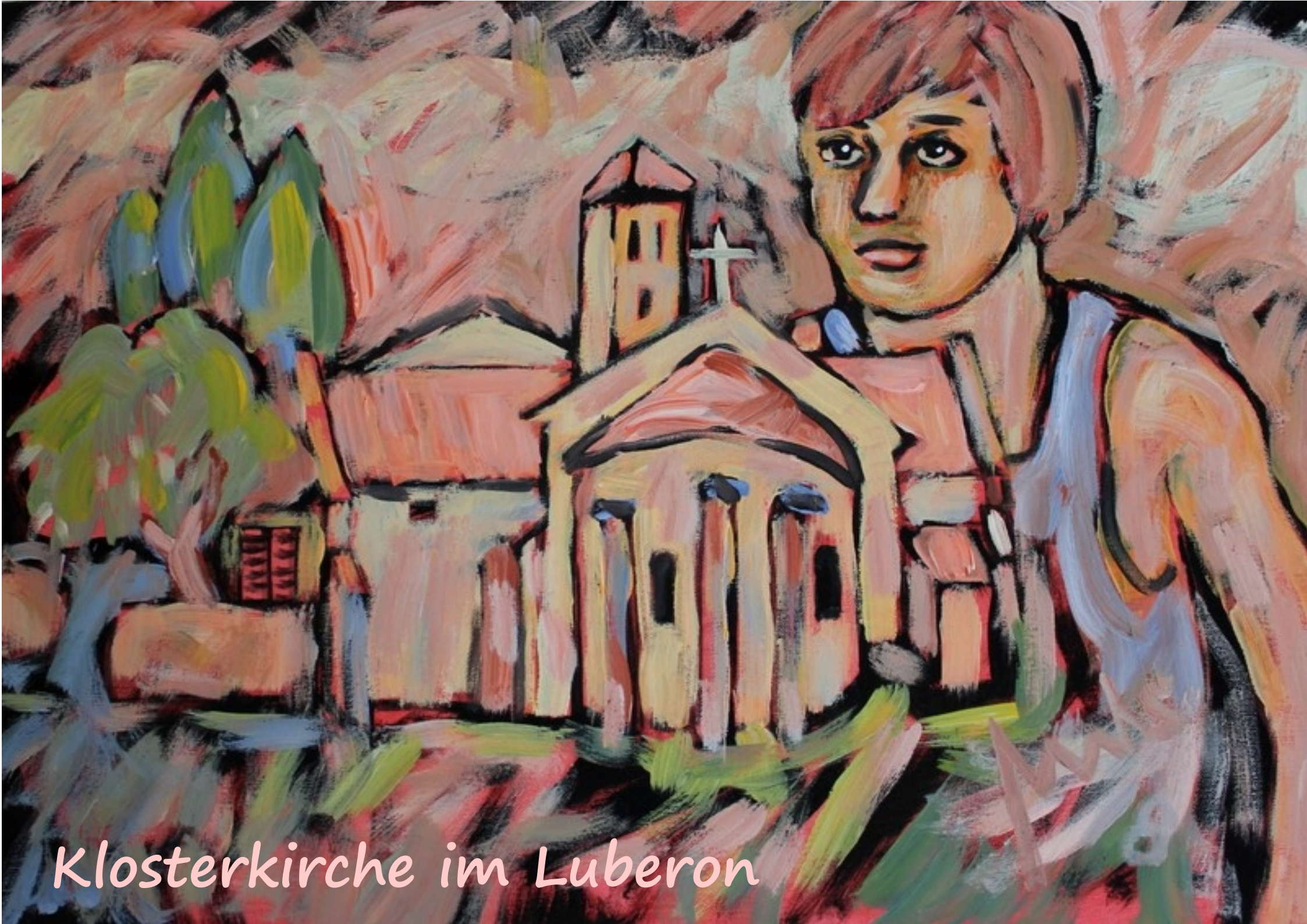
Klosterkirche im Luberon