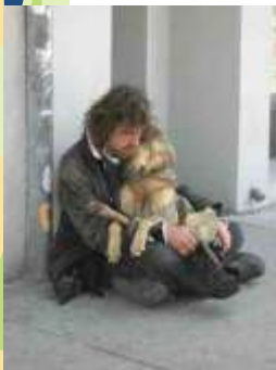
Obdachlose - Ausgestoßene

dich will ich prei - sen, du bist mein Heil.