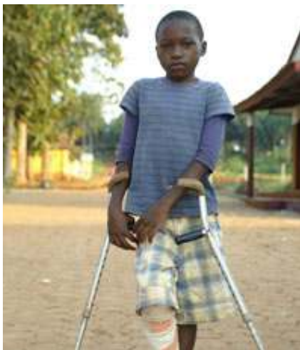
Lepa-Kranke - Ausgestoßene

Jesus heilt den Aussätzigen (Lukas 5, 12-14).