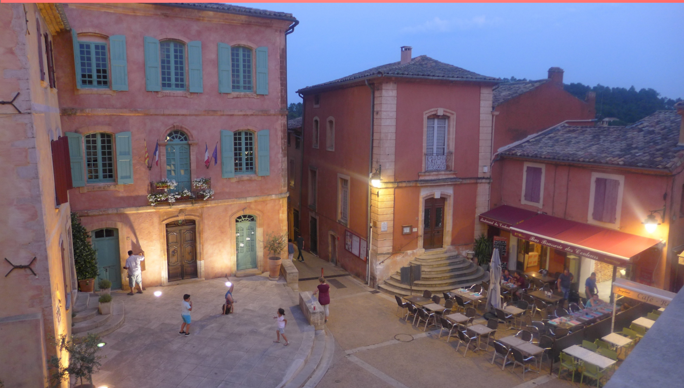
Blick vom Glockenturm auf den Marktplatz