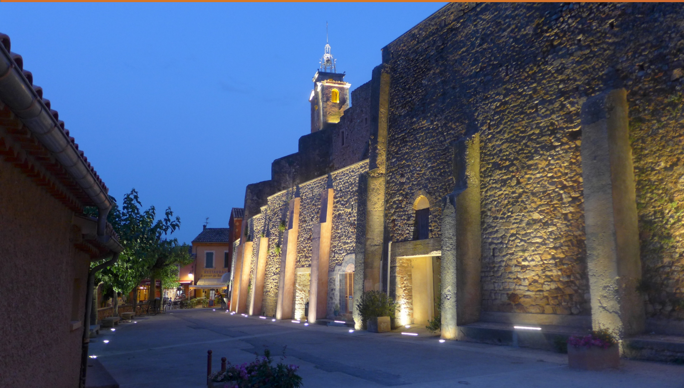
Marktplatz mit Glockenturm