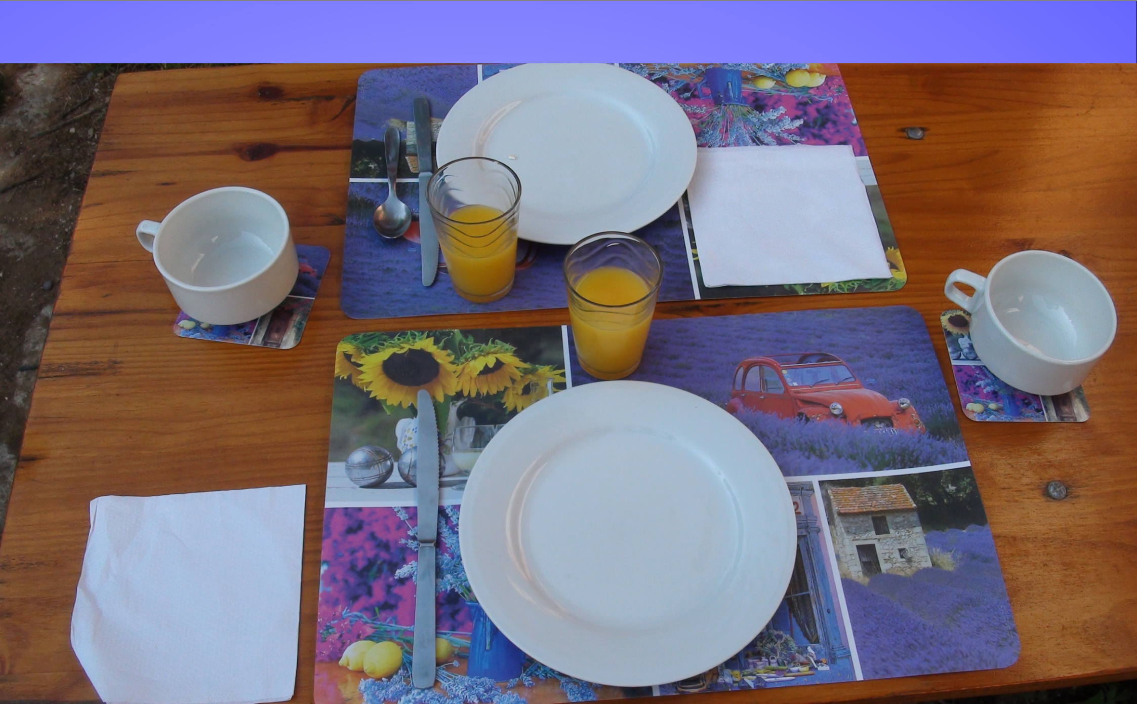
Frühstück am Zebrastreifen